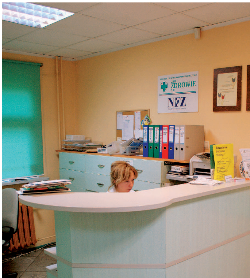
Wprowadzenie w zakładzie dokumentacji elektronicznej pozwoliło na zmniejszenie liczby dokumentów papierowych oraz zwiększenie liczby przyjmowanych pacjentów

W placówce wprowadzono także innowacyjny na skalę wielkości zakładu system zarządzania, który oparty jest na koncepcji systemu controllingu